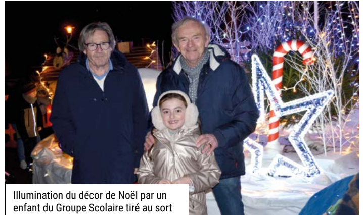
Illumination du décor de Noël par un enfant du Groupe Scolaire tiré au sort