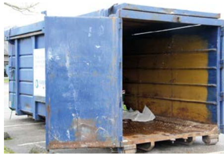
Opération benne à papier menée par Enfance Avenir du 14 au 21 janvier.