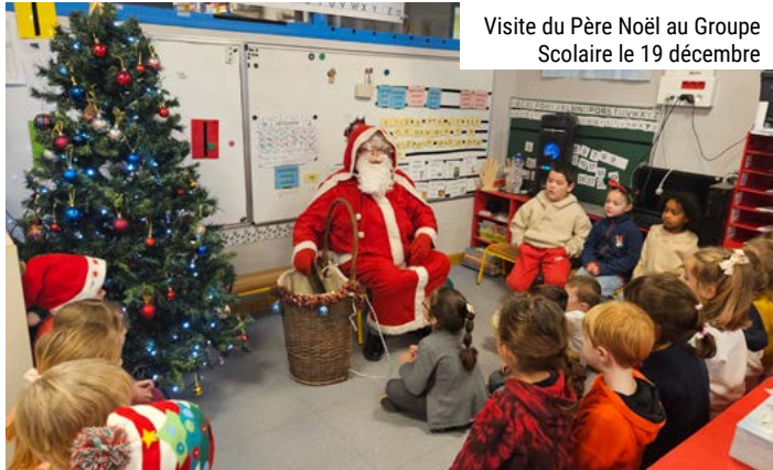
Visite du Père Noël au Groupe Scolaire le 19 décembre