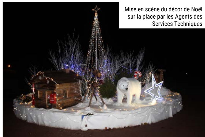
Mise en scène du décor de Noël sur la place par les Agents des Services Techniques