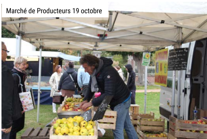
Marché de Producteurs 19 octobre