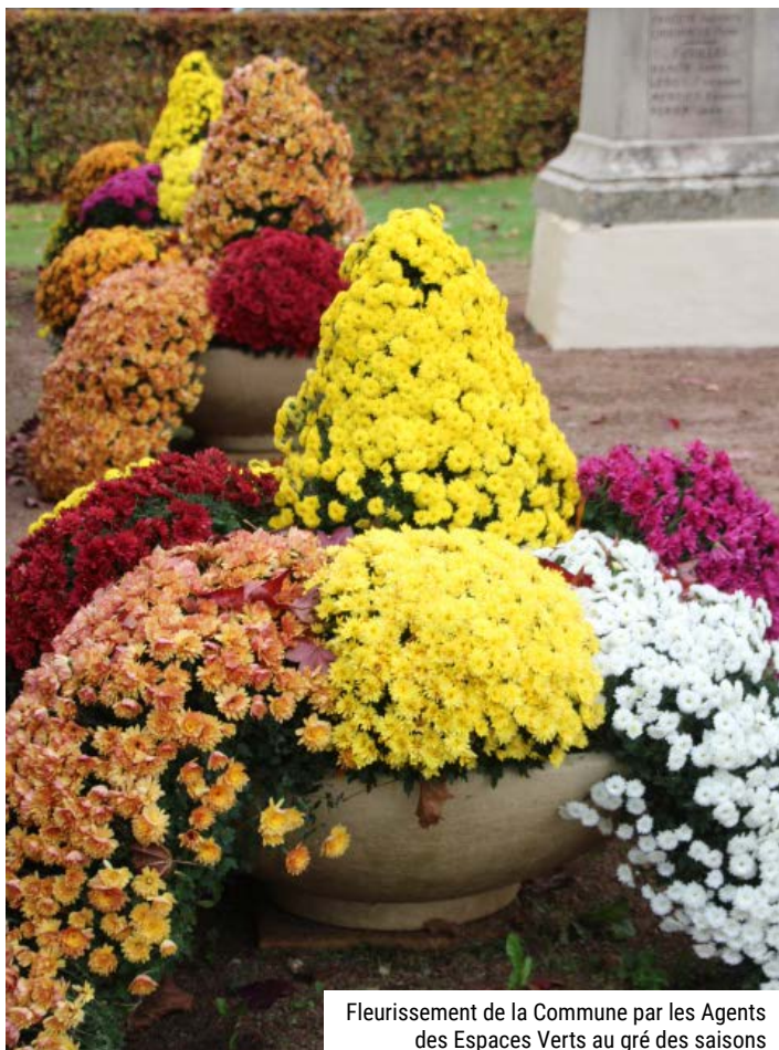
Fleurissement de la Commune par les Agents des Espaces Verts au gré des saisons